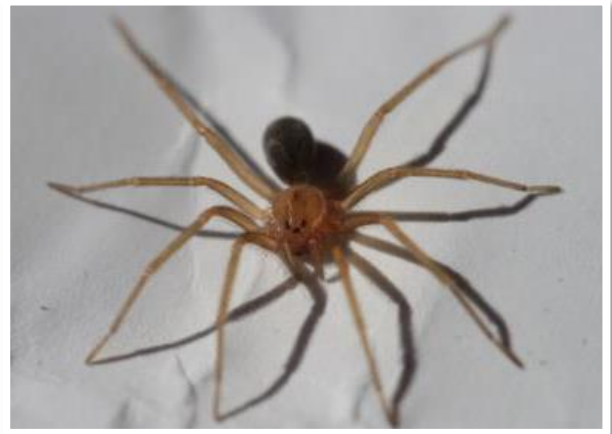
"Recluse spider shot in Santa Catarina - Brazil"